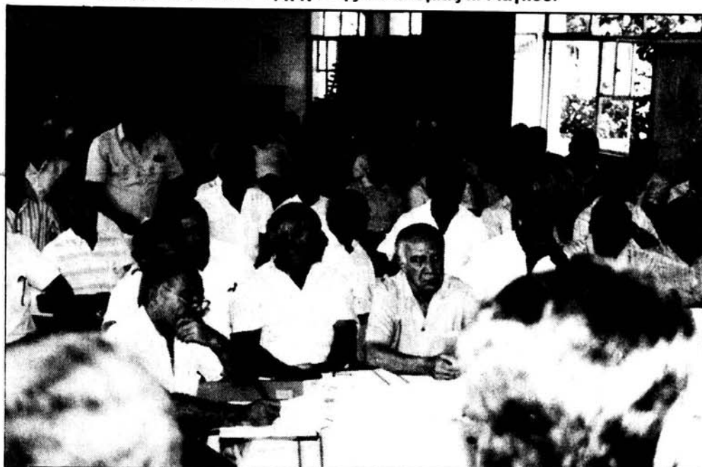
Πολλοί Φοινοῦτες και κάτοικοι των γύρω χωριών παρακολούθησαν την περιφερειακή σύσκεψη που έγινε στο Φοινί.