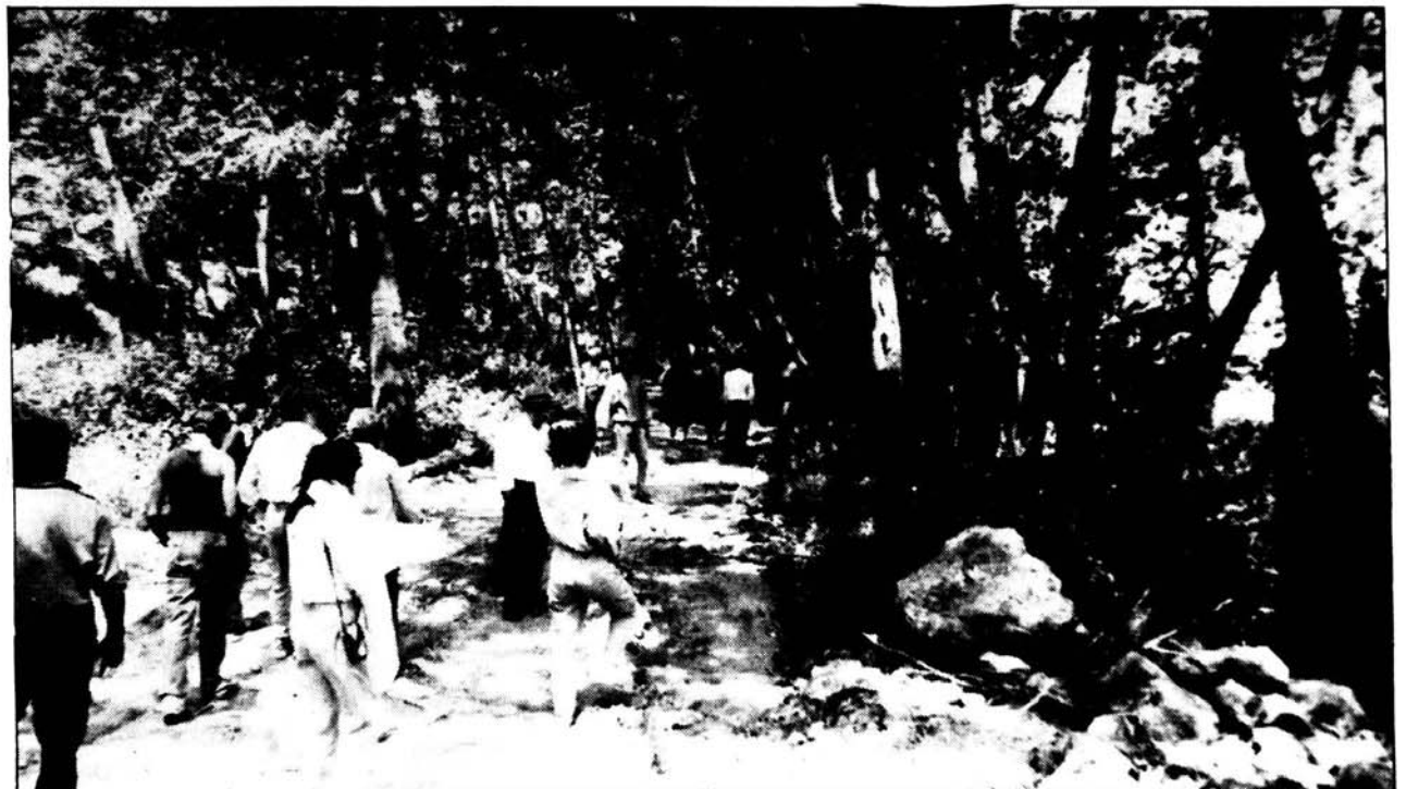
Πρόσφατος αγώνας για το νερό του Διαρίζου

Πολύ διαβάστηκε η ιστορία της μάχης των Φοινιωτών που δημοσιεύτηκε στα «Φοινιωτικά Νέα» για το νερό του Διαρίζου.