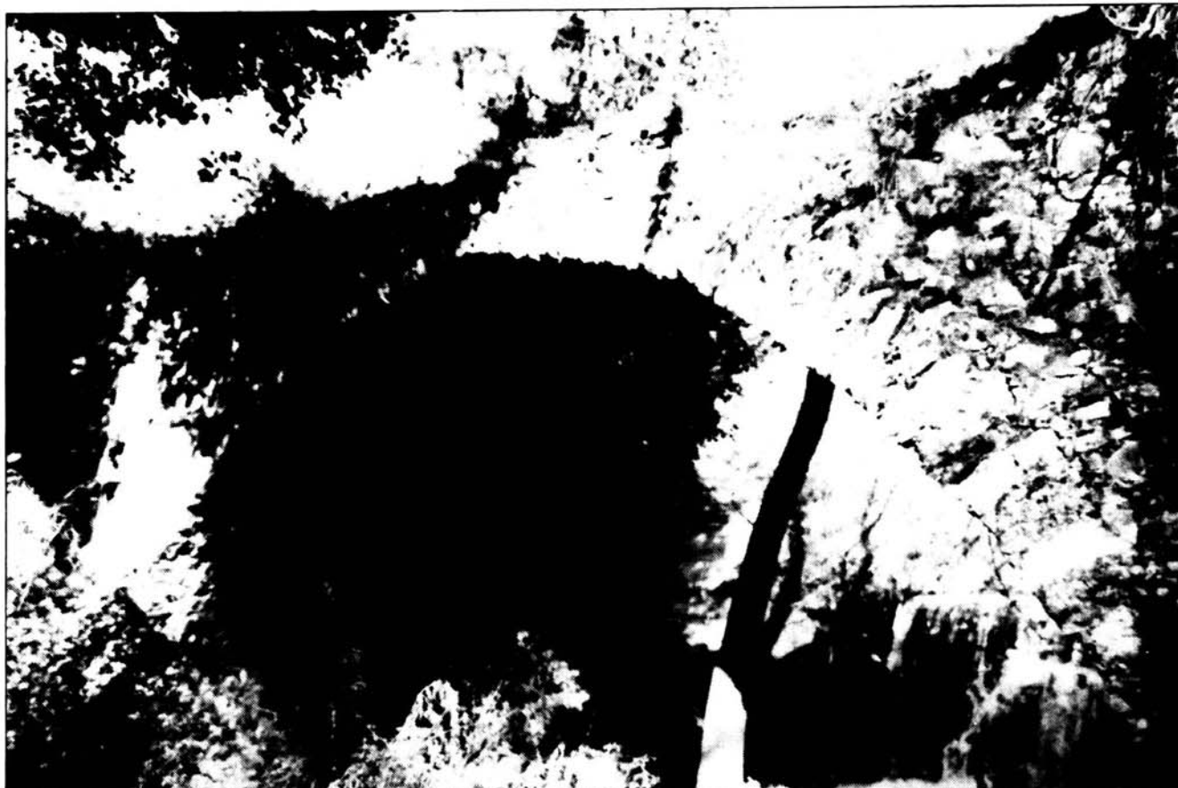
Το γιοφύρι του «Πισκόπου», απολαύστε το σ' ένα από τους περιπάτους που σας προτείνουμε.