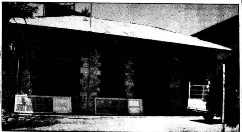
Το ανακαινιζόμενο κτίριο όπου θα στεγαστεί το Κέντρο Νεότητας Φοινίου.