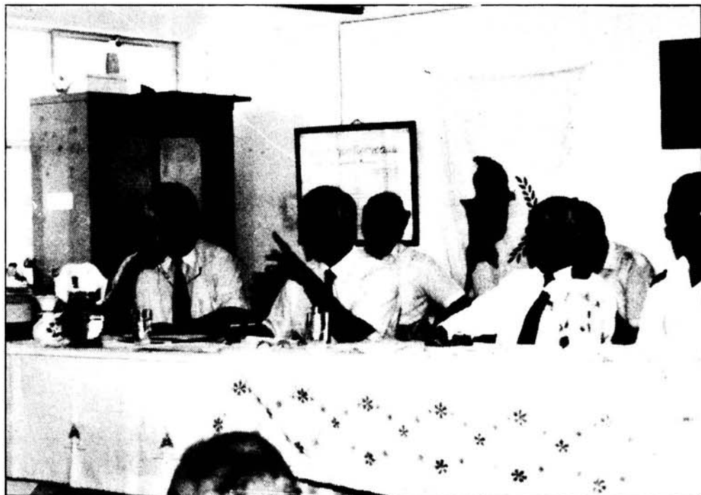
Ο υπουργός Εσωτερικών Χρ. Βενιαμίν ανάμεσα στον έπαρχο Λεμεσού κ. Αγγελίδη και τον αρχηγό της Αστυνομίας κ. Γιάγκου.

Με τη σύσκεψη αυτή μπαίνουν κάποιες βάσεις για την ανάπτυξη του χωριού μας. Από εδώ και μπρος θα πρέπει να γίνουν μεγαλύτερες προσπάθειες από όλους για την επίτευξη αυτών των στόχων.