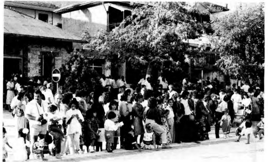
Νέοι, γέροι, γυναίκες, παιδιά παρακολουθούν τους χορευτές και τις χορεύτριες.