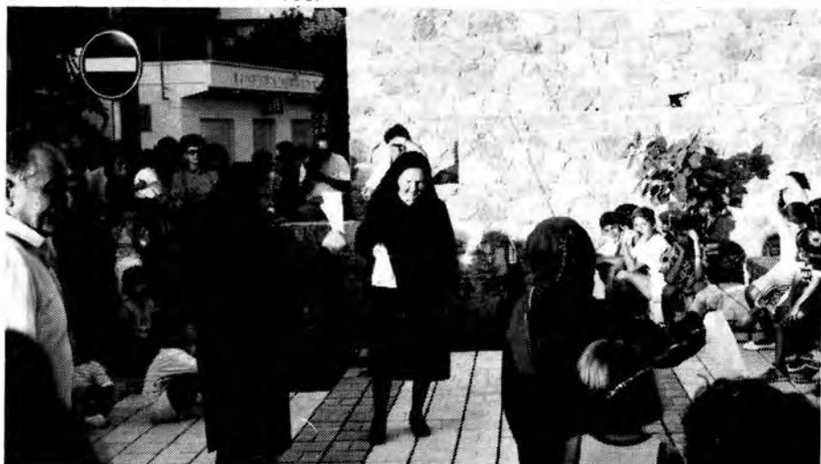
Οι μεγάλες «κοπέλες» μας δείχνουν πως χόρευαν παλιά.

Μετά τους χαιρετισμούς και μέχρι τις πρωινές ώρες Φοινιώτες και ξένοι διασκέδασαν και χόρευαν υπό τους ήχους της ορχήστρας της αστυνομίας.