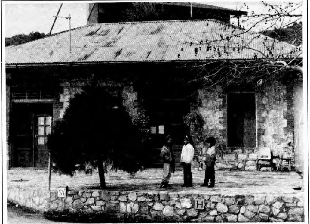
Πραγματικά όμορφο το οίκημα του Κέντρου Νεότητας Φοινιού. Αν η στέγη καλυφθεί με κεραμίδια θα γίνει απίθανο