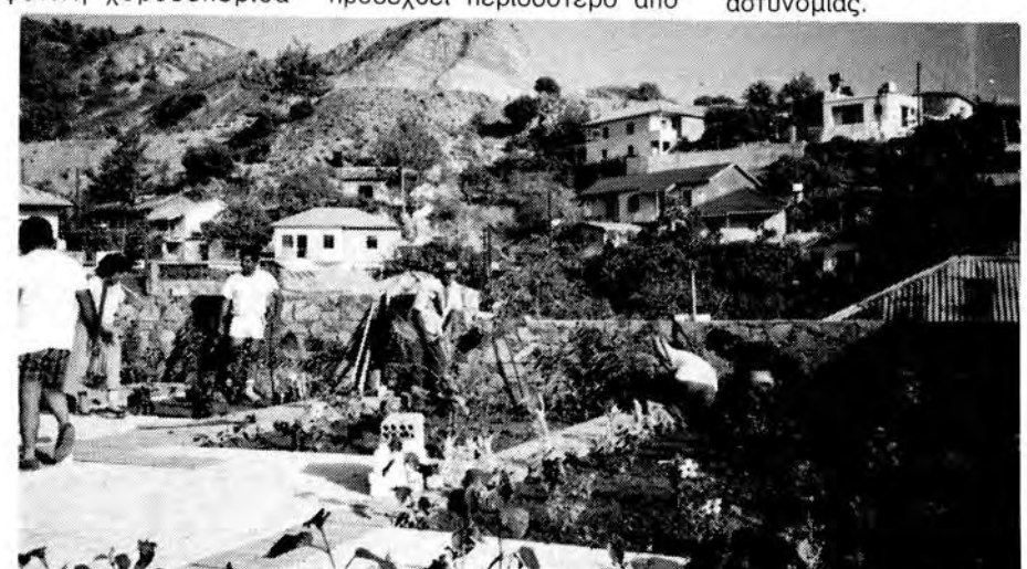
Μέλη του Συνδέσμου μας και της Χωριτικής Αρχής βοηθούν στην καλύτερη διαμόρφωση της πλατείας.