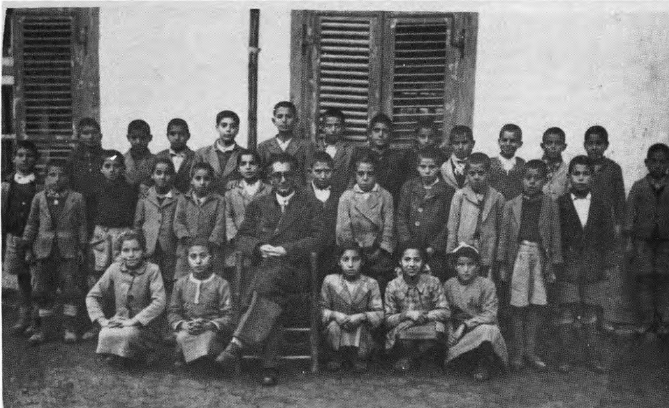
Ε' και ΣΤ' τάξη Δημοτικού Σχολείου Φοινιού 1948 - 1949

Γλυκά αντηχεί το «Καλημέρα» παντού αδονούν ύμνοι χαράς κι η «πουλουστρίνα» δίνει, παίρνει και σπαρταρά η μικρή καρδιά.