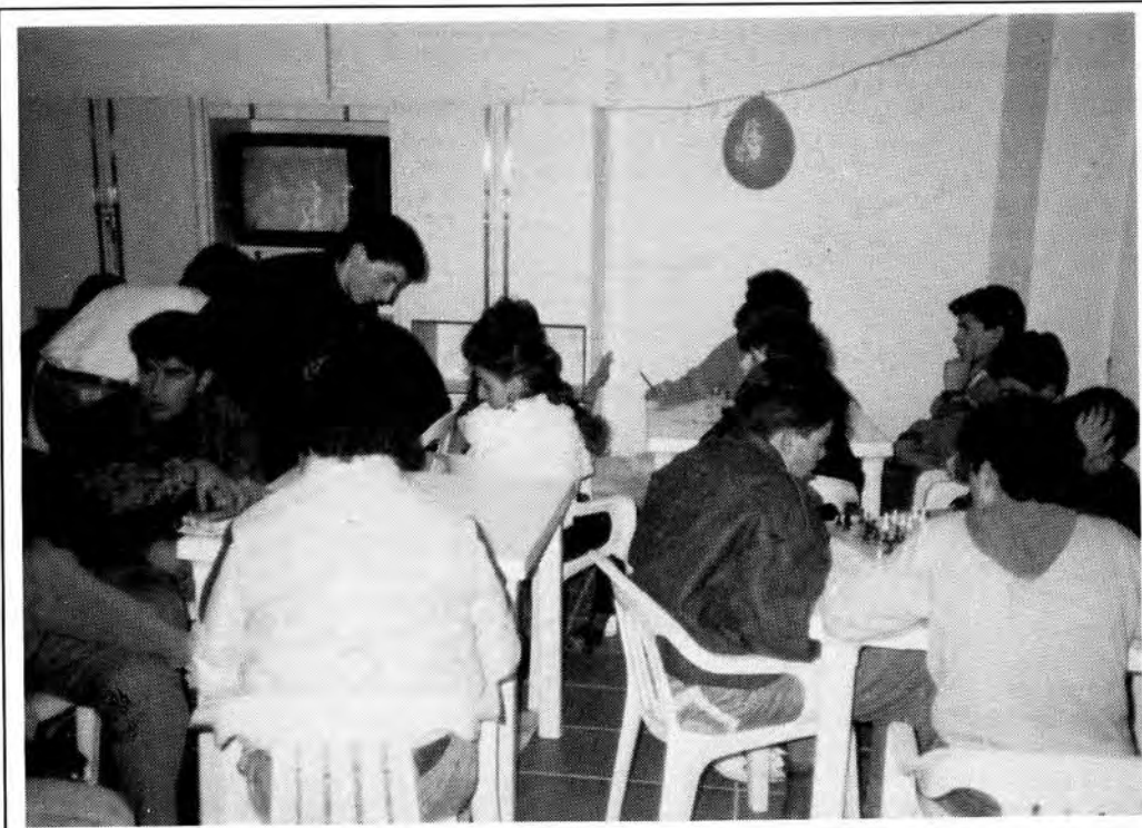
Εξοπλισμένο πλήρως το οίκημα του Κ.Ν.Φ. αποτελεί το στέκι των νέων.

3. Ποδοσφαιρικές συναντήσεις (εφτά σε κάθε ομάδα) διάρκειας 40 λεπτών (20 σε κάθε ημίχρονο) για μεγάλους - παντρεμένους, ελεύθερους κ.λπ. Το βράδυ της ίδιας μέρας έγινε στο κέντρο «Μύλος» Πασχαλινή Συνεστίαση και διεξήχθη τόνπολα.