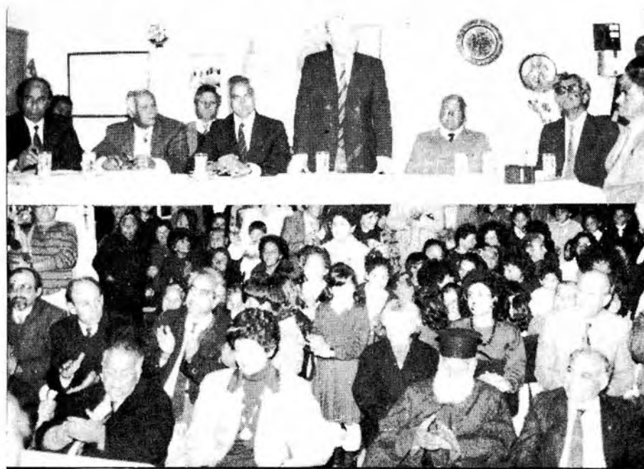
Μέτρα για καταπολέμηση της αστυφιλίας εξήγγειλε ο Πρόεδρος Βασιλείου κατά την επίσκεψή του.

Όσον αφορά την ανάπτυξη βιομηχανιών και βιοτεχνιών στην υπαίθρο, έχει ετοιμαστεί σχέδιο βάσει του οποίου θα παραχωρείται σημαντική βοήθεια για την ίδρυση μικρής βιομηχανίας στην υπαίθρο. Η βοήθεια θα περιλαμβάνει τη διασφάλιση παροχής ηλεκτρι-