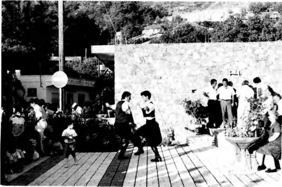
Χοροί από τους νέους στη νέα πλατεία.

Η όλη εκδήλωση, κατά γενική ομολογία, ήταν πράγματι εξαιρετική. Σ' αυτό, ίσως, συνέβαλε κι ο ωραίος χώρος που διαρρυθμίστηκε κατάλληλα από το Σύνδεσμο Αποδήμων Φοινιωτών και τη Χωριτική Αρχή. Ως γνωστό με έξοδα του ΣΑΦ κατασκευάστηκε στο χώρο που έγινε η εκδήλωση ωραία πλατεία που θα συμπληρωθεί αργότερα και με το μνημείο ηρώων της κοινότητας Δήμου Ηροδότου και Ευσταθίου Ξενοφώντος, ενώ η Χωριτική Αρχή ανακαίνισε παλιό κτίριο της κοινότητας όπου φιλοξενήθηκε και η